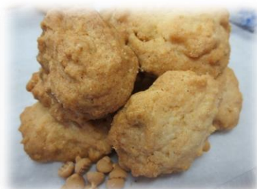
⑫キャラメルクッキー