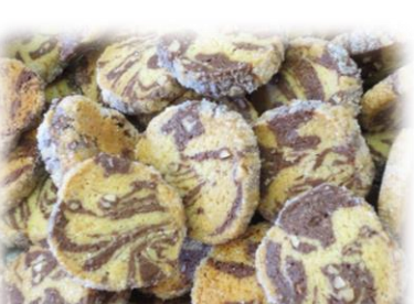
⑧マーブルクッキー