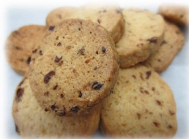
⑩レーズンクッキー