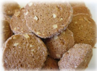
⑥シナモンクッキー