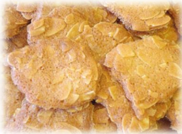
①アーモンドチュール