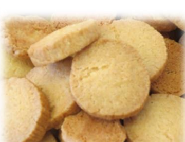
⑦プレーンクッキー