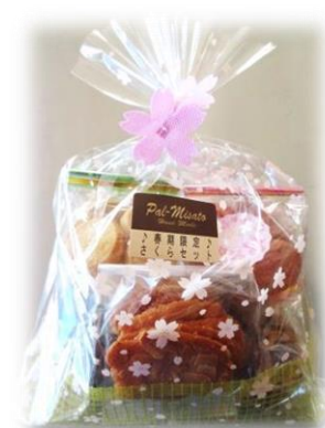
⑬クッキーセット(5個入り)